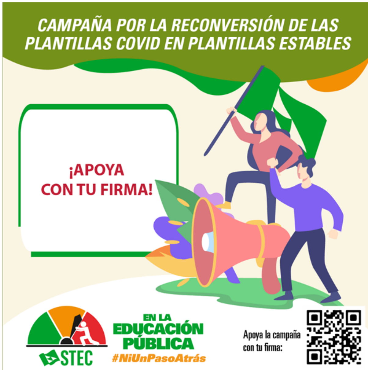
imagen para firmar.