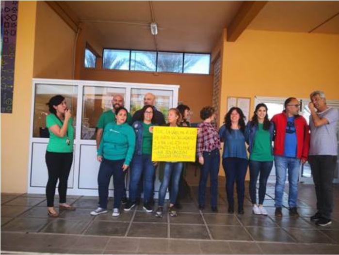
IES San Sebastián de la Gomera