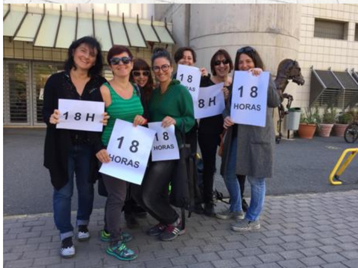
EASD Gran Canaria