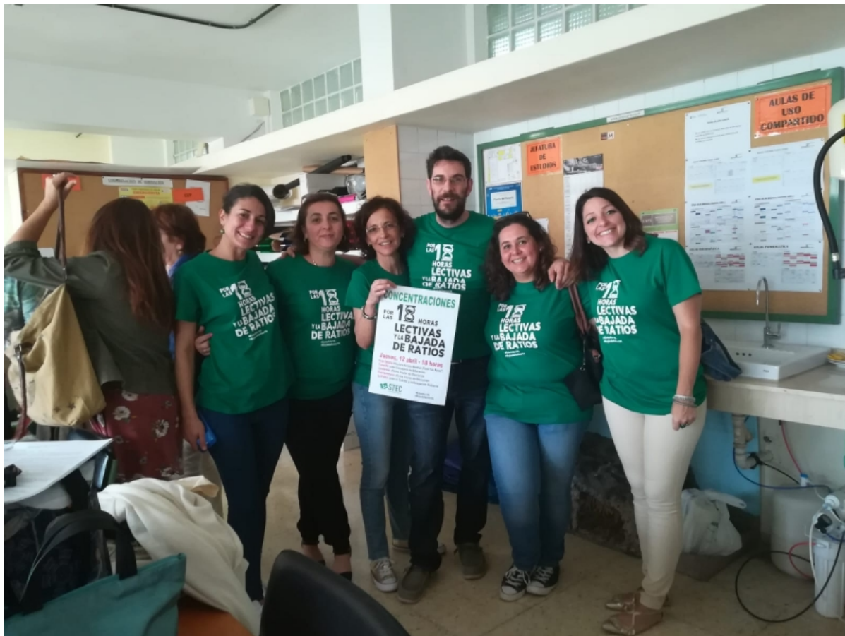
del Rosario (Fuerteventura).